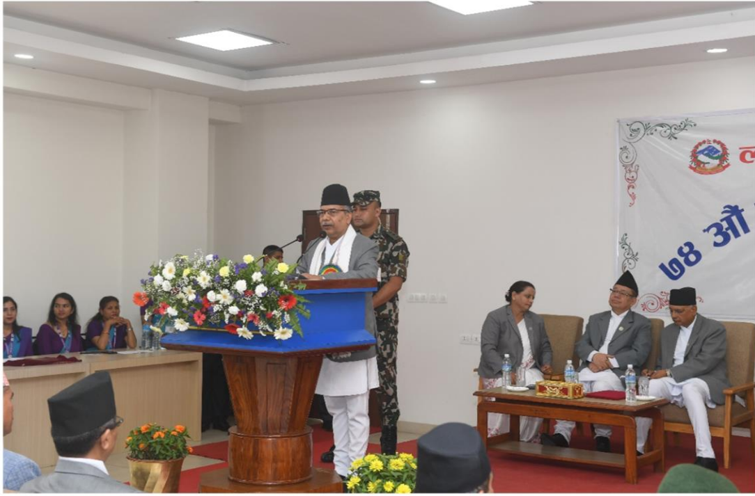
शुभकामना मन्तव्य राखनुहुँदै सम्माननीय कार्यवाहक राष्ट्रपतिज्यू