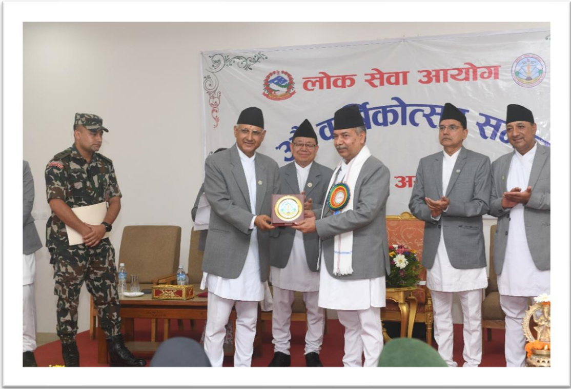
मायाको चिनो ग्रहण गर्नुहुँदै सम्माननीय कार्यवाहक राष्ट्रपतिज्यू