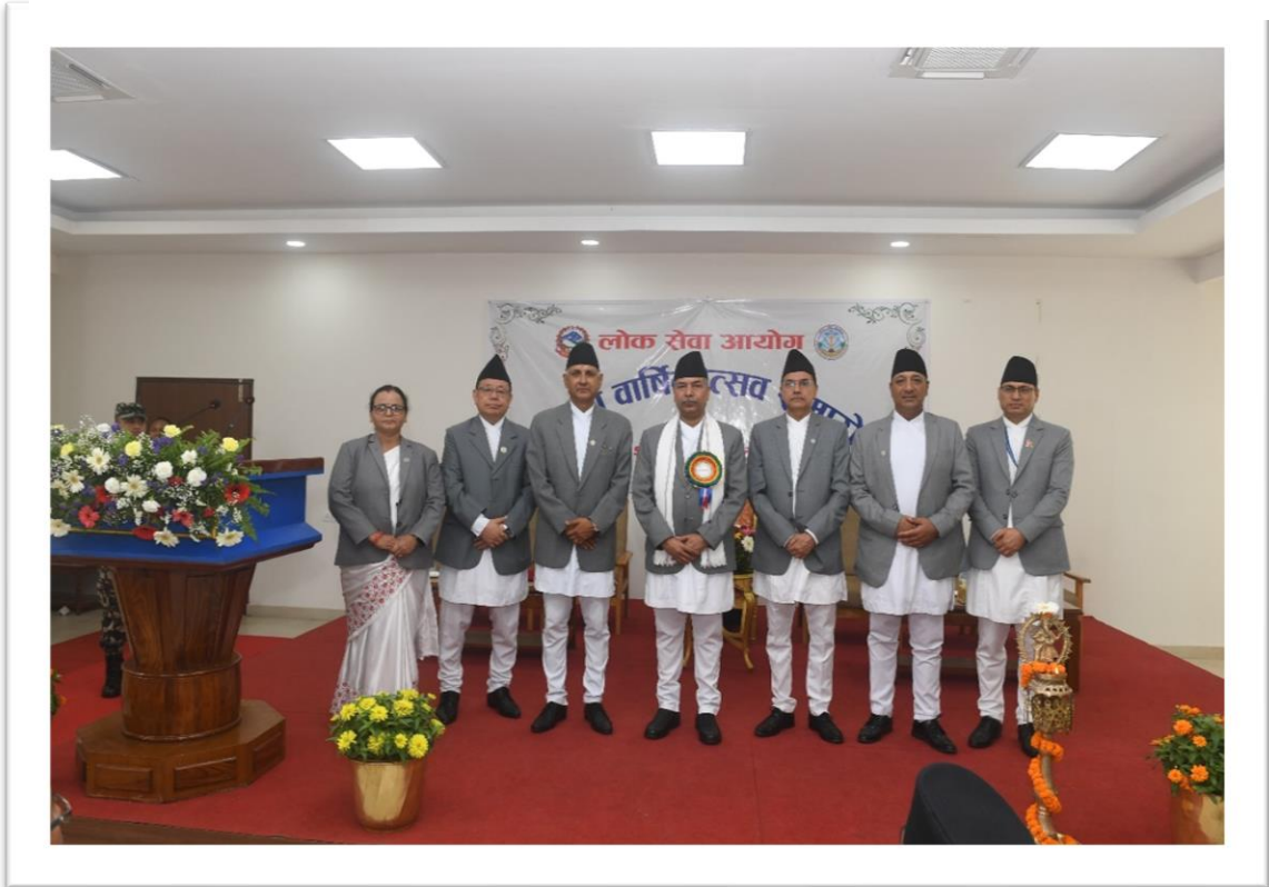
सम्माननीय कार्यवाहक राष्ट्रपतिज्यूसंग आयोग पदाधिकारीहरुको सामूहिक तस्विर