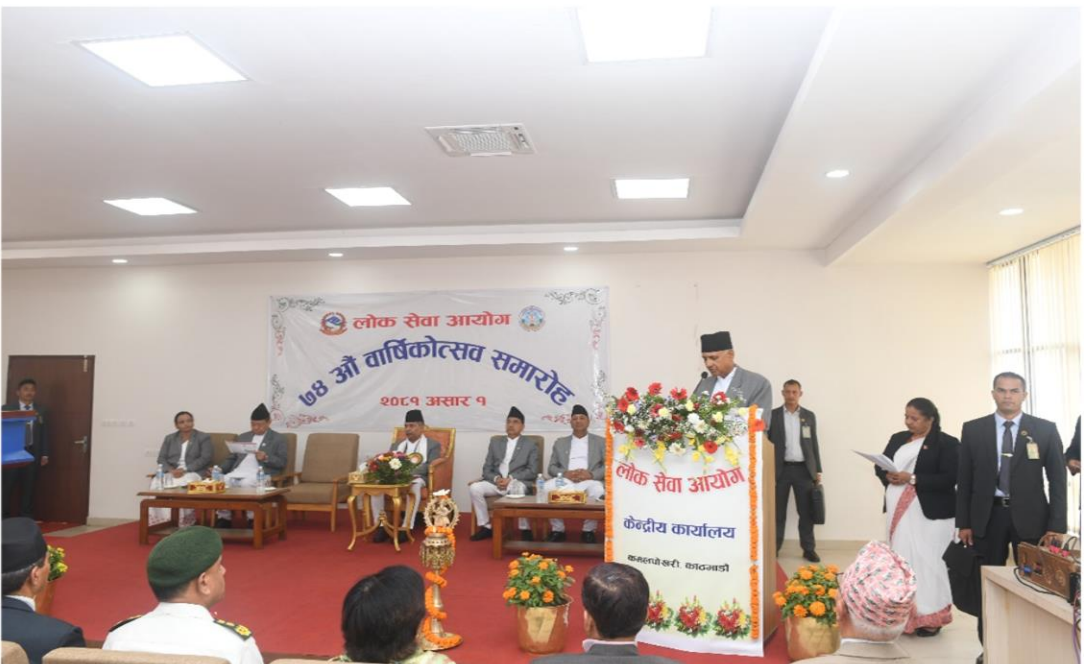
मन्तव्य राखनुहुँदै लोक सेवा आयोगका माननीय अध्यक्ष