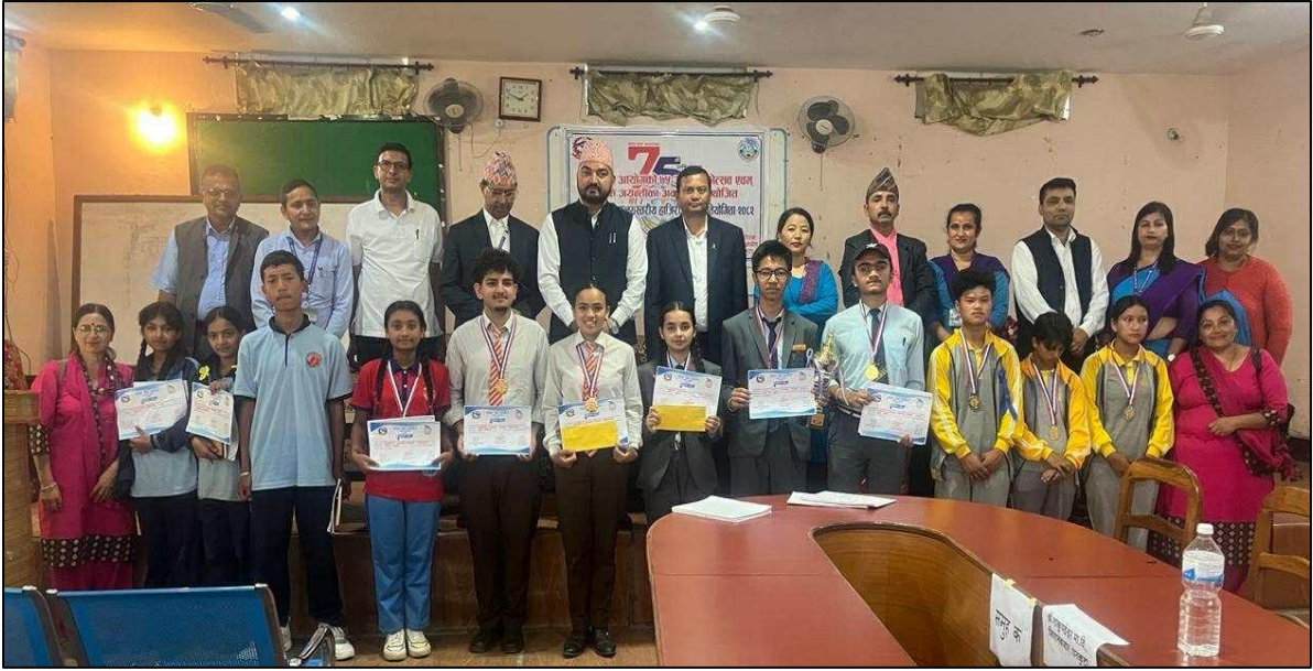
(७५ औं वार्षिकोत्सव एवं हीरक जयन्तीको अवसरमा सुर्खेत कार्यालयबाट आयोजना गरिएको हाजिरीजवाफ प्रतियोगिता)