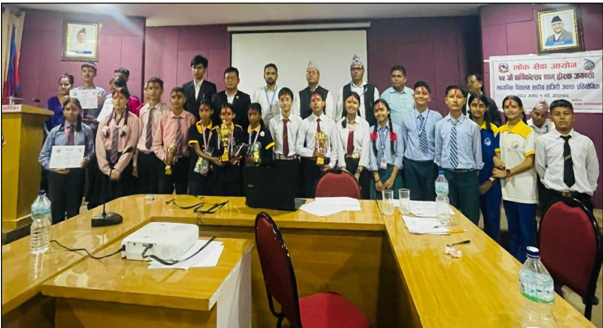
(७५ औं वार्षिकोत्सव एवं हीरक जयन्तीको अवसरमा बागलुङ कार्यालयबाट आयोजना गरिएको हाजिरीजवाफ प्रतियोगिता)