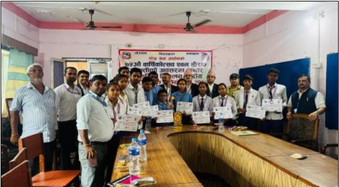
(७५ औं वार्षिकोत्सव एवं हीरक जयन्तीको अवसरमा जलेश्वर कार्यालयबाट आयोजना गरिएको हाजिरीजवाफ प्रतियोगिता)