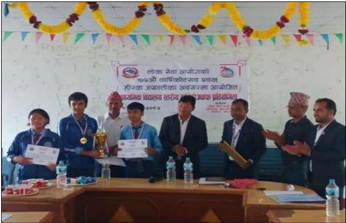
(७५ औं वार्षिकोत्सव एवं हीरक जयन्तीको अवसरमा खोटाङ कार्यालयबाट आयोजना गरिएको हाजिरीजवाफ प्रतियोगिता)