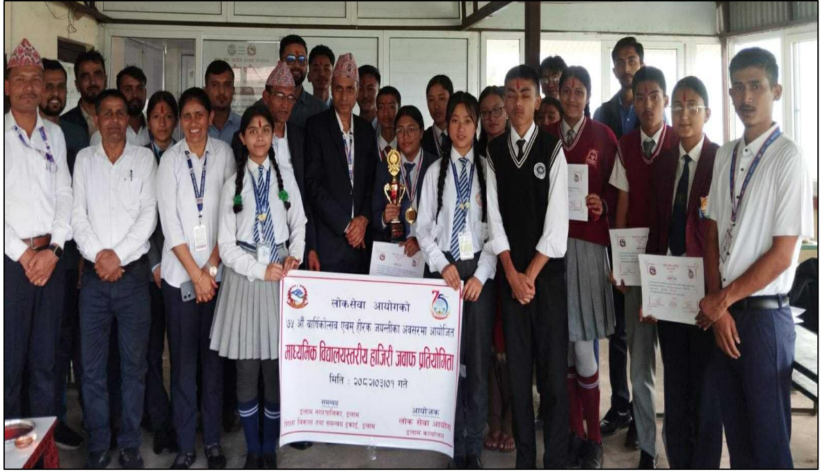
(७५ औं वार्षिकोत्सव एवं हीरक जयन्तीको अवसरमा इलाम कार्यालयबाट आयोजना गरिएको हाजिरीजवाफ प्रतियोगिता)