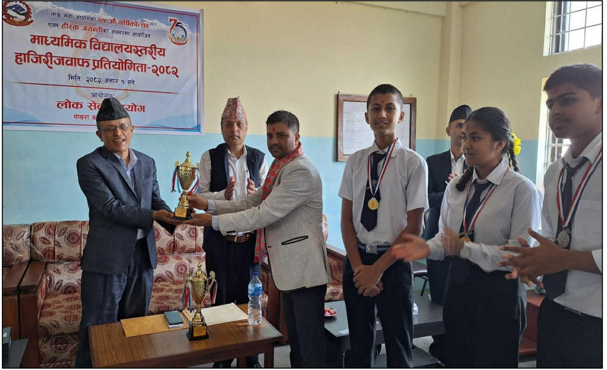
(७५ औं वार्षिकोत्सव एवं हीरक जयन्तीको अवसरमा पोखरा कार्यालयबाट आयोजना गरिएको हाजिरीजवाफ प्रतियोगिता)