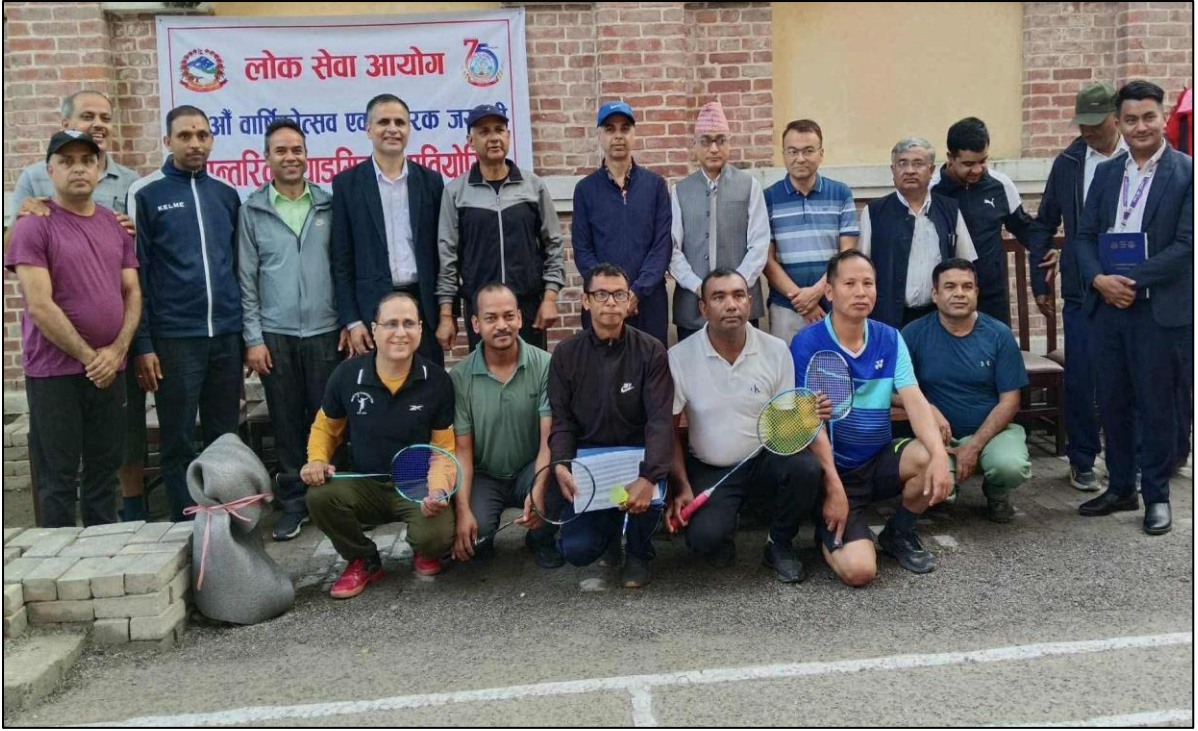
(७५ औं वार्षिकोत्सव एवं हीरक जयन्तीको अवसरमा आयोजना गरिएको व्याडमिन्टन कार्यक्रम)