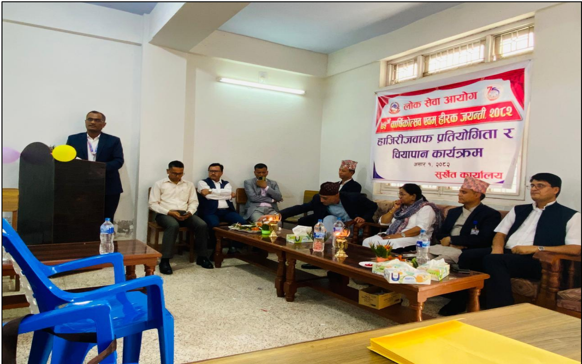
(७५ औं वार्षिकोत्सव एवं हीरक जयन्तीको अवसरमा धनकुटा कार्यालयबाट आयोजना गरिएको हाजिरीजवाफ प्रतियोगिता)