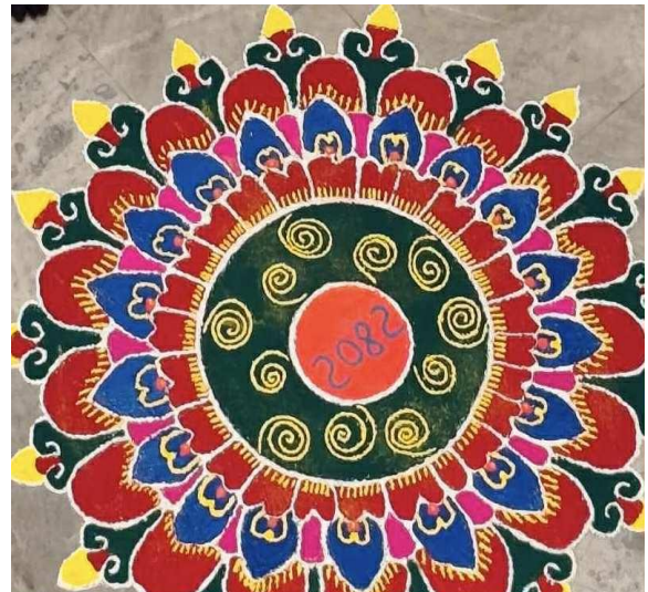
(७५ औं वार्षिकोत्सव एवं हीरक जयन्तीको अवसरमा तयार पारिएको रंगोली)