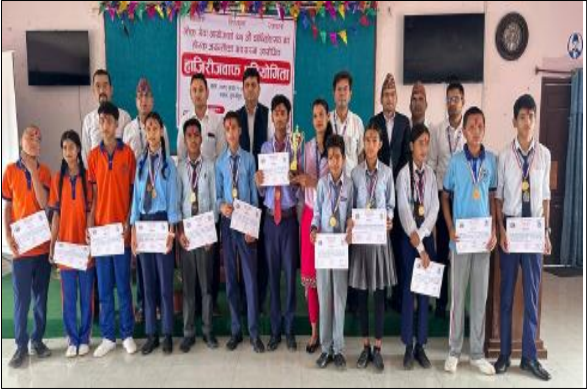
(७५ औं वार्षिकोत्सव एवं हीरक जयन्तीको अवसरमा दाङ कार्यालयबाट आयोजना गरिएको हाजिरीजवाफ प्रतियोगिता)