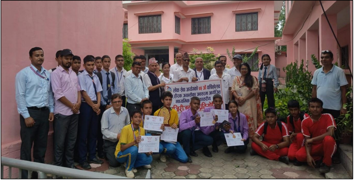
(७५ औं वार्षिकोत्सव एवं हीरक जयन्तीको अवसरमा महेन्द्रनगर कार्यालयबाट आयोजना गरिएको हाजिरीनामा प्रतियोगिता)