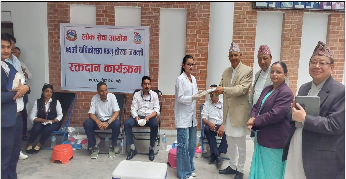
(७५ औं वार्षिकोत्सव एवं हीरक जयन्तीको अवसरमा आयोजना गरिएको रक्तदान कार्यक्रम)