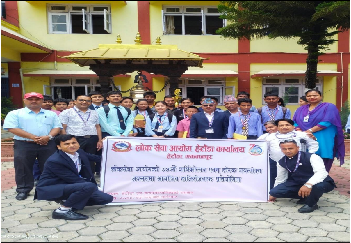
(७५ औं वार्षिकोत्सव एवं हीरक जयन्तीको अवसरमा हेटौडा कार्यालयबाट आयोजना गरिएको हाजिरीजवाफ प्रतियोगिता)