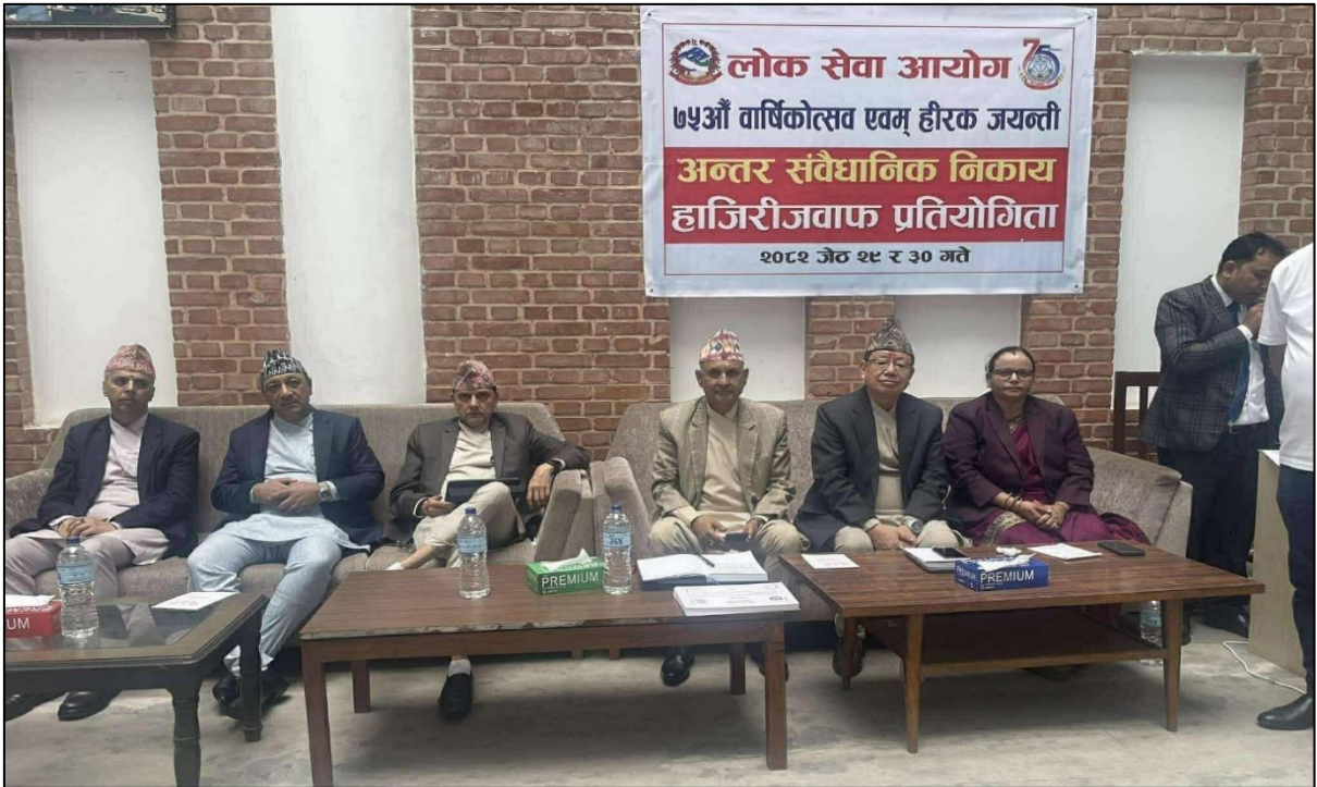
(७५ औं वार्षिकोत्सव एवं हीरक जयन्तीको अवसरमा आयोजना गरिएको अन्तर संवैधानिक निकाय हाजिरीजवाफ प्रतियोगिता)