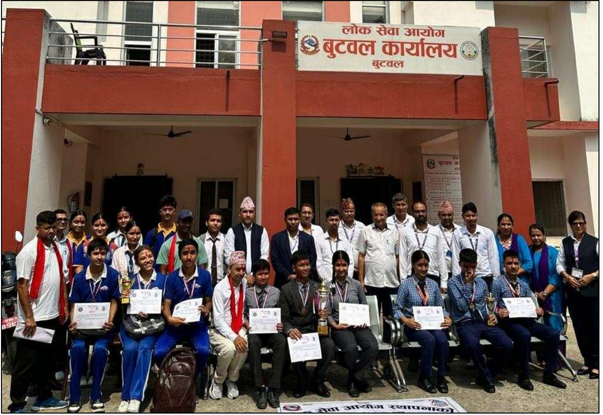
(७५ औं वार्षिकोत्सव एवं हीरक जयन्तीको अवसरमा बुटवल कार्यालयबाट आयोजना गरिएको हाजिरीजवाफ प्रतियोगिता)