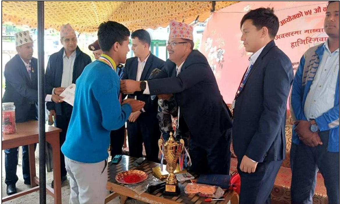
(७५ औं वार्षिकोत्सव एवं हीरक जयन्तीको अवसरमा जुम्ला कार्यालयबाट आयोजना गरिएको हाजिरीजवाफ प्रतियोगिता)