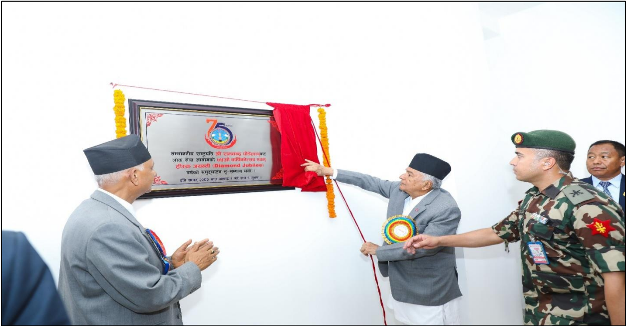
(लोक सेवा आयोगको हीरक जयन्ती वर्ष समुद्घाटन गर्नु हुँदै सम्माननीय राष्ट्रपति रामचन्द्र पौडेलज्यू)