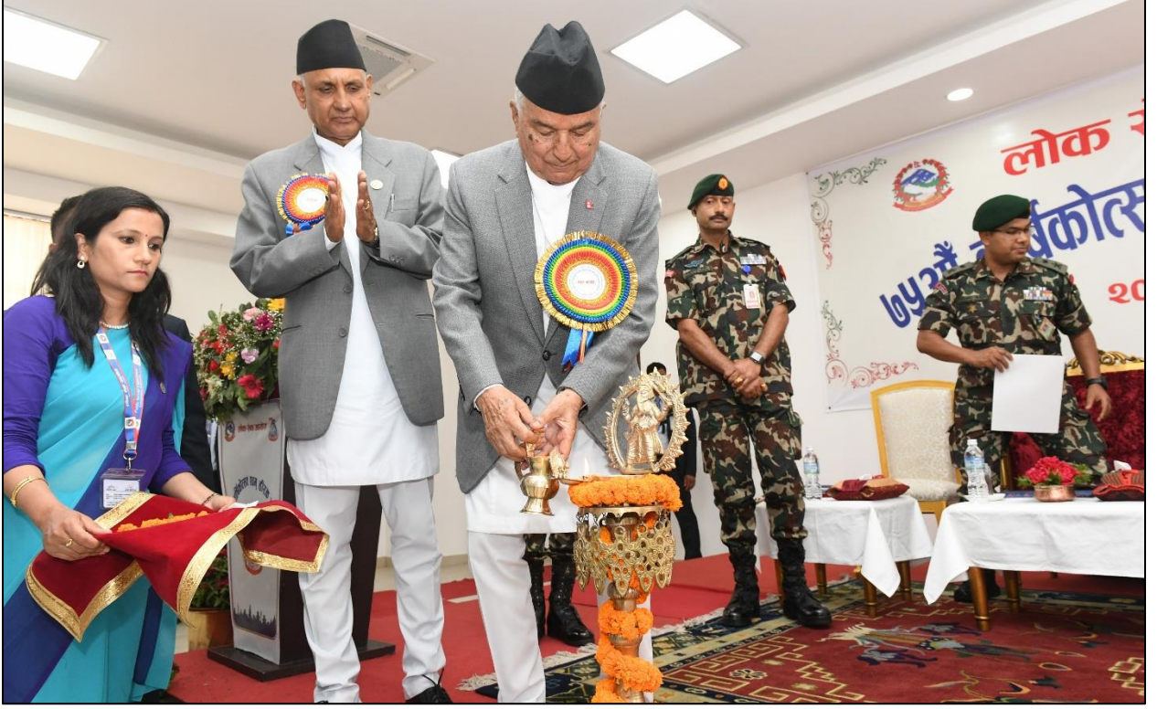
(वार्षिकोत्सव एवम हीरक जयन्ती कार्यक्रम समुद्घाटन गर्नु हुँदै सम्माननीय राष्ट्रपति रामचन्द्र पौडेलज्यू)