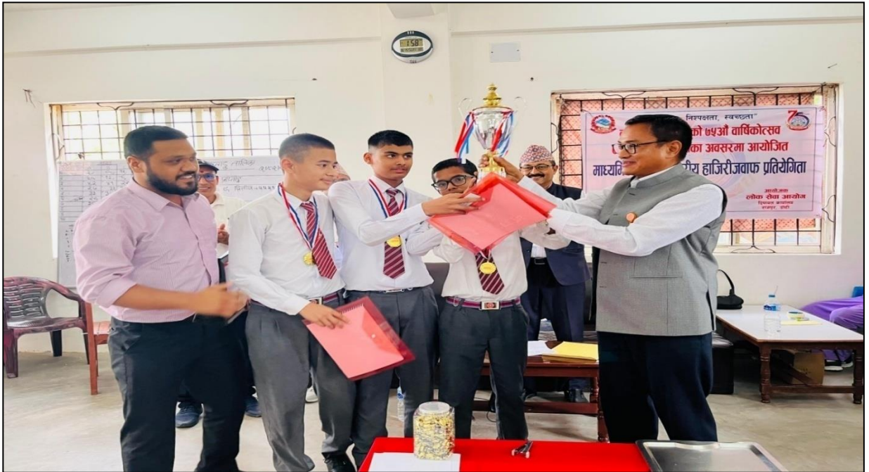
(७५ औं वार्षिकोत्सव एवं हीरक जयन्तीको अवसरमा दिपायल कार्यालयबाट आयोजना गरिएको हाजिरीजवाफ प्रतियोगिता)